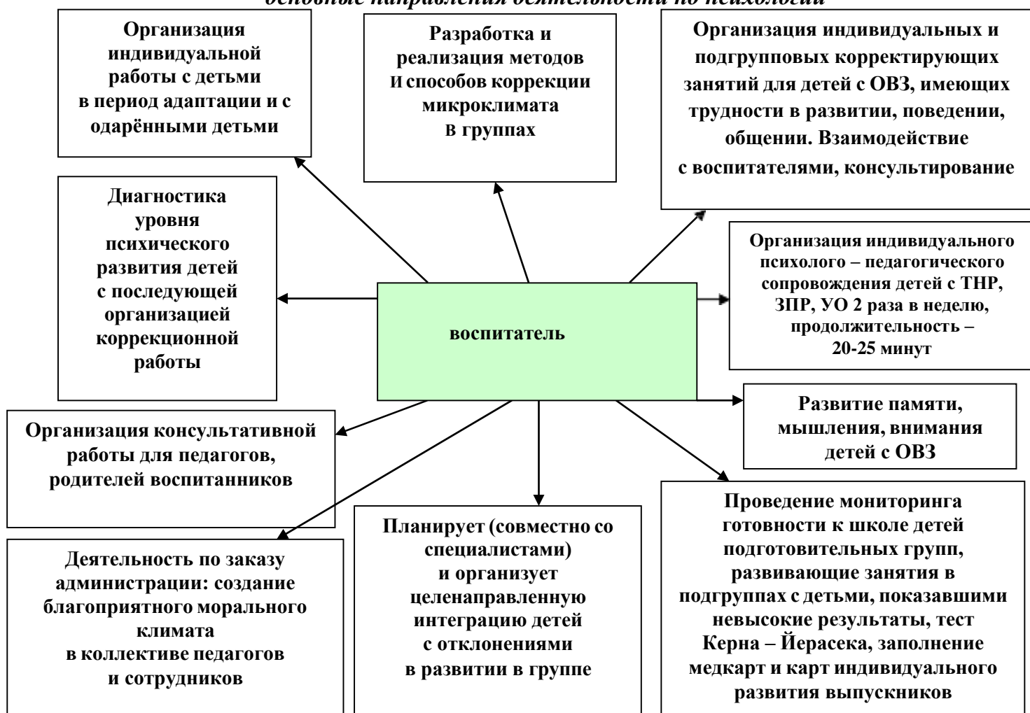
Рис. 2 «основные направления деятельности»